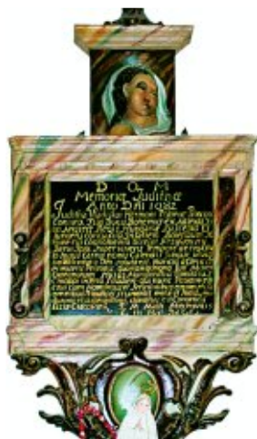
Tablica księżnej Judyty w kościele pw. św. Mateusza

Któremu miastu kapituła krakowska „uzyczyła” herbu, a kościołowi kopii tablicy czczącej księżnę