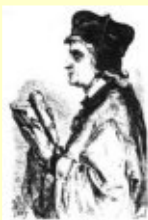
Portret Jana Długosza wg Jana Matejki

Jan Długosz (1415—1480), ur. w Brzeźnicy k. Pajęczna, wybitny historyk, dyplomata, kanclerz kardynała Z. Oleśnickiego, nauczyciel synów króla Kazimierza Jagiellończyka. Od 1436 r. kanonik krakowski, w 1480 r. nominowany na arcybiskupstwo lwowskie. Autor wielu dzieł historycznych, zwłaszcza „Historiae Poloniae” i „Liber beneficiorum...”. Obszerne materiały źródłowe zbierał w terenie, m.in. w 1466 r. — jako lustrator, przedstawiciel kapituły krakowskiej — w kapitulnych włościach pabianickich. Był także członkiem komisji rozstrzygającej sprawę graniczne tych dóbr. Zmarł w Krakowie, pochowany w panteonie na Skalce.